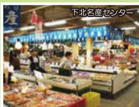
下北名産センター