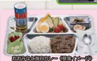
おのみなと海自カレー (昼食イメージ)