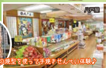
南部鉄器の焼型を使って手焼きせんべい体験♪