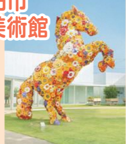
チェ:ジョンファ(フラワー・ホース)