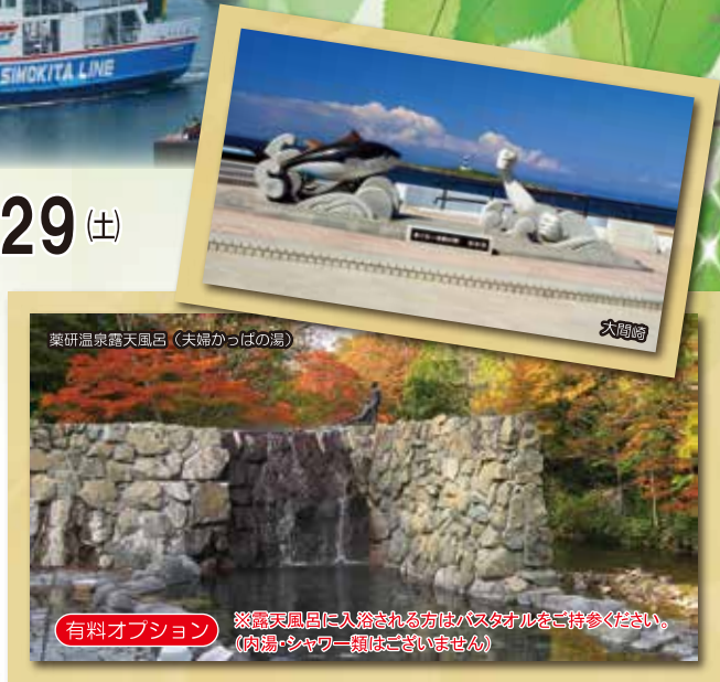
薬研温泉露天風呂(夫婦かつばの湯)