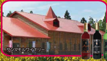
サンマモルワイナリー