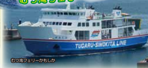
むつ湾フェリーかもしか