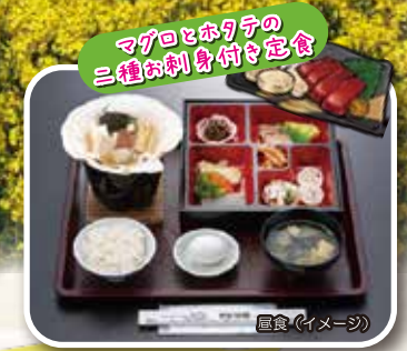
マグロとホリケテの三種のお刺身付き定食