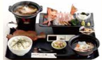
中泊メバルの刺身と煮付け膳 (イメージ)

青森駅交番前——弘前バスターミナル——アップルロード——弘前市太宰治まなびの家——津軽五所川原駅++++金木駅—— 8:00発 11番のりば 9:30発 (約60分) (見学) 【津軽鉄道ストーブ列車】 (約30分) 【昼食】中泊メバルの刺身と煮付け膳 【観劇・買物】 【案内付き見学】 ——はくちよう亭奈良屋——津軽伝統「金多豆蔵人形芝居」——太宰治疎開の家 (旧津島家新座敷)—— (約45分) (約60分) (約30分) 【休憩】 五所川原市乾橋経由 道の駅つた鶴の里あるじゃ——弘前バスターミナル——青森駅交番前 (約30分) 17:30着 18:50着