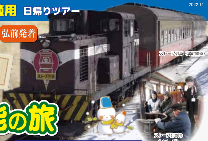
ストーブ列車 (津軽鉄道)