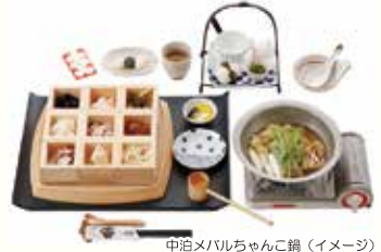
中泊メバルちゃんこ鍋 (イメージ)

弘前バスターミナル——青森駅交番前——トッパラスト——小説「津軽」の像記念館—— 11番のりば 6:45発 8:15発 (約20分) (休憩) (見学) (約30分) 【昼食】中泊メバルちゃんこ鍋 【観劇・買物】 【津軽鉄道ストーブ列車】 ——しじみ亭奈良屋——津軽伝統「金多豆蔵人形芝居」——津軽中里駅+++++++金木駅—— (約45分) (約60分) 13:37乗車 13:52下車 【案内付き見学】 【休憩】 ——太宰治記念館「斜陽館」——道の駅なみおかアップルヒル——青森駅交番前——弘前バスターミナル (約40分) (約20分) 16:40着 18:00着