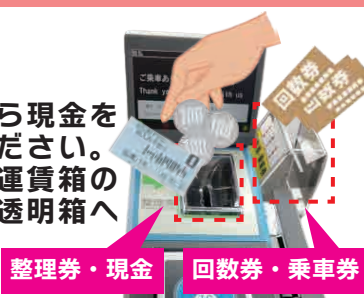
整理券・現金 回数券・乗車券

整理券を入れてから現金を 運賃箱へお入れください。 回数券・乗車券は運賃箱の 横に設置してある透明箱へ お入れください。