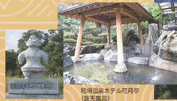
亀ヶ岡石器時代遺跡

青森駅交番前 — 弘前バスターミナル — 大森勝山遺跡 — つがる市縄文住居展示資料館 — 7:00発 11番のりば 8:20発 【見学】(約40分) 【見学】(約30分) — 霧ヶ峰温泉 ホテル花月亭 — 亀ヶ岡石器時代遺跡/田小屋野貝塚 — 大山ふるさと資料館/大平山元遺跡 — 【昼食・入浴休憩】(約110分) 【見学】(約60分) 【見学】(約50分) — 村の駅もっと — 青森駅交番前 — 弘前バスターミナル 【休憩】(約20分) 17:20着 18:30頃着