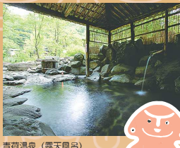
青荷温泉 (霧ヶ峰山荘)

弘前バスターミナル — 青森駅交番前 — 小牧野遺跡 — 11番のりば 7:20発 8:40発 【見学】(約40分) — 三内丸山遺跡 — ランプの宿 青荷温泉 — 中野もみじ山 — 【見学】(約90分) 【昼食・入浴休憩】(約120分) 【散策】(約30分) — 津軽伝承工芸館 — 弘前バスターミナル — 青森駅交番前 【見学・買物】(約40分) 17:20着 18:40頃着