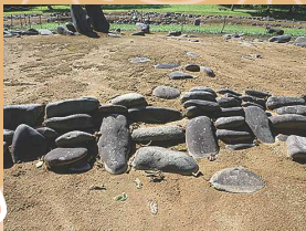
小牧野遺跡